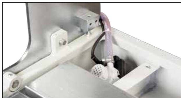
Pompa di ricircolo acqua. Water recirculation pump.