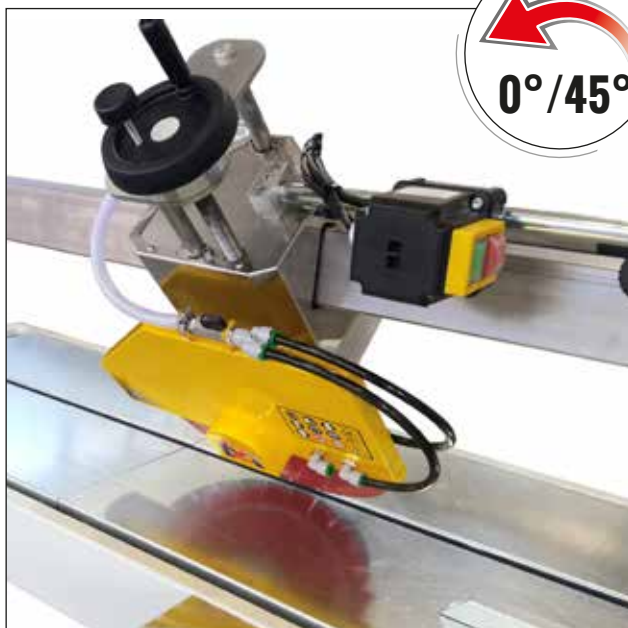
Sollevamento testa asse "Z" manuale con volantino. Manual lifting head "Z" Axis with hand wheel.