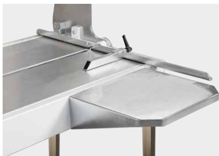
Pianetto in acciaio con battuta laterale e ortogonale. Supporting steel table with lateral and orthogonal rollaway back stops.