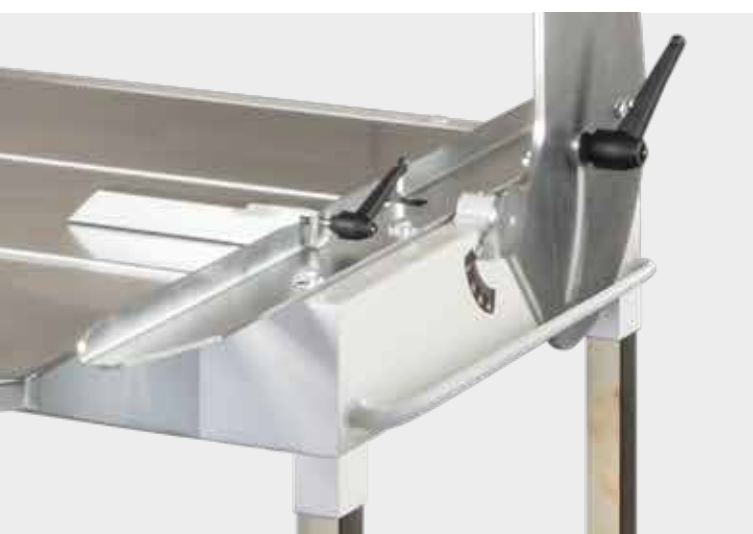
Maniglia di sollevamento. Lifting hand.